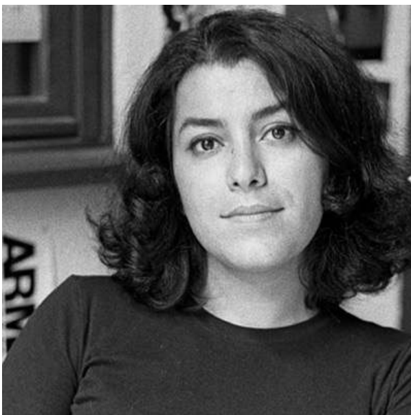
Photo de Marjane Satrapi