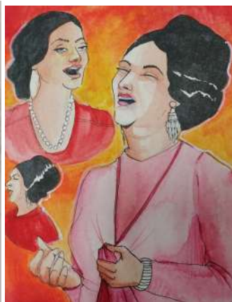
Croquis pour la BD sur la chanteuse Oum Kalthoum.