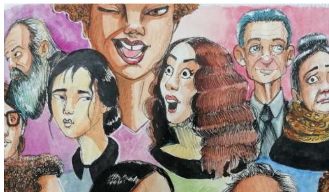
Dessins extraits de son carnet et montrant des visages de personnes très différents.